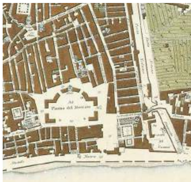
Real Ufficio Topografico, Pianta del Quartiere Mercato, 1828