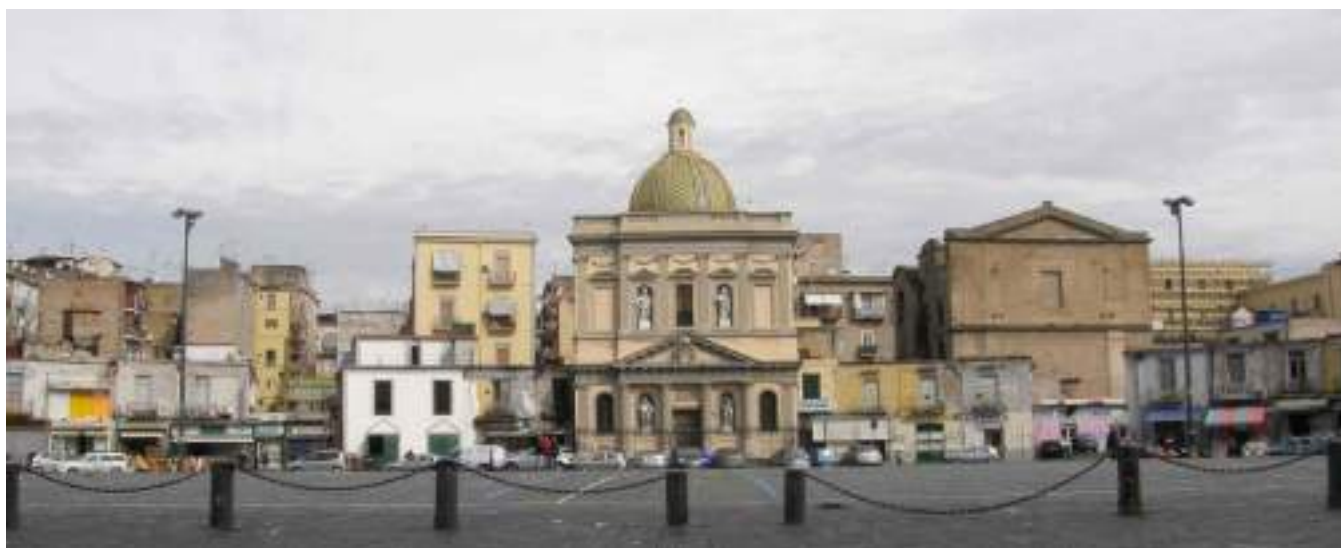
Fotografia della facciata nello stato attuale