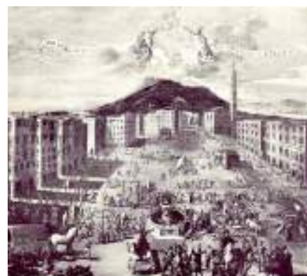
D. Gargiulo, La peste a Napoli nel 1656 in piazza Mercato, Napoli Museo Nazionale di San Martino