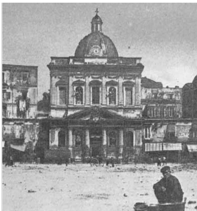
Chiesa di Santa Croce al Mercato in una immagine storica fine X IX secolo

Il prospetto principale si presenta sviluppato su due ordini a cinque moduli ognuno con un'apertura. Le due distinte zone sono unite con un timpano che è posto al centro di una composizione virtuale quadrata delimitata in corrispondenza dei quattro angoli da nicchie verticali che ospitano altrettante sculture di santi. Lo sviluppo complessivo del prospetto è proporzionale al quadrato compositivo di cui si è detto per cui l'immagine della chiesa è quella di "solidità", "fermezza" con una spinta verso la spiritualità determinata dalla posizione del timpano.