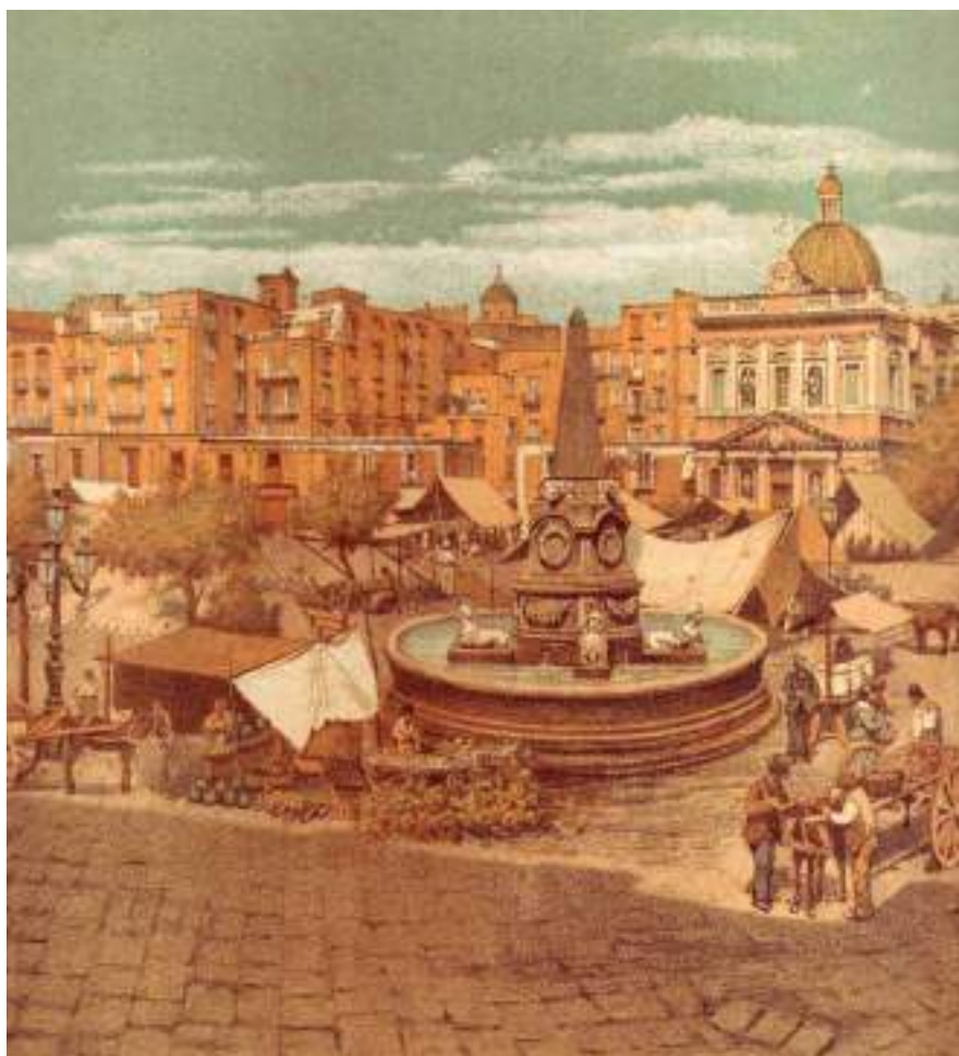
D. Gargiulo (detto Micco Spadaro), Largo Mercato; Toledo, Museo de la Fundación Duque de Lerma

La piazza, poi, è particolarmente celebre per essere stata il luogo dove ebbe inizio la rivoluzione di Masaniello, il quale nacque e visse in una casa alle spalle della piazza.