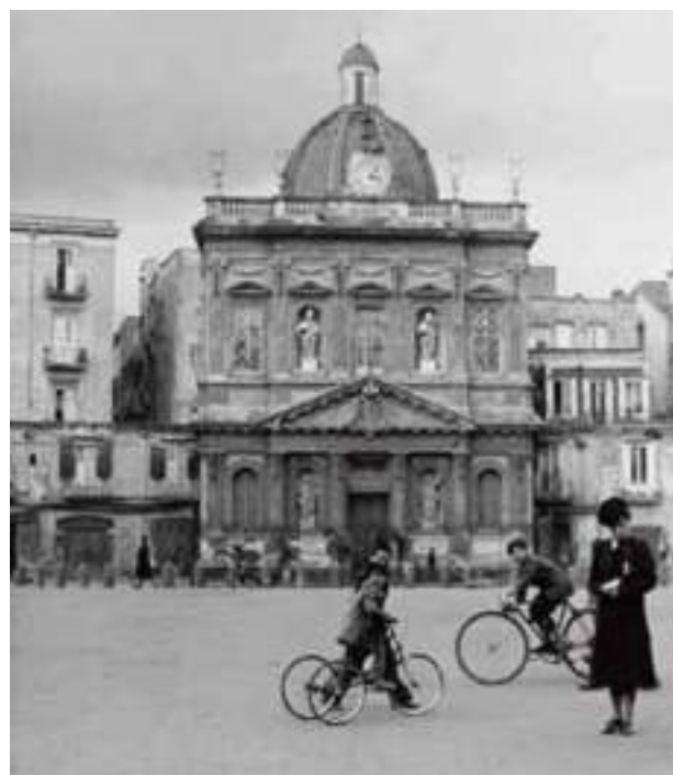
Chiesa di Santa Croce al Mercato in una immagine storica del 1930 circa