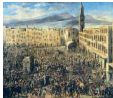
D. Gargiulo Piazza Mercato durante la rivolta di Masaniello, 1648 circa