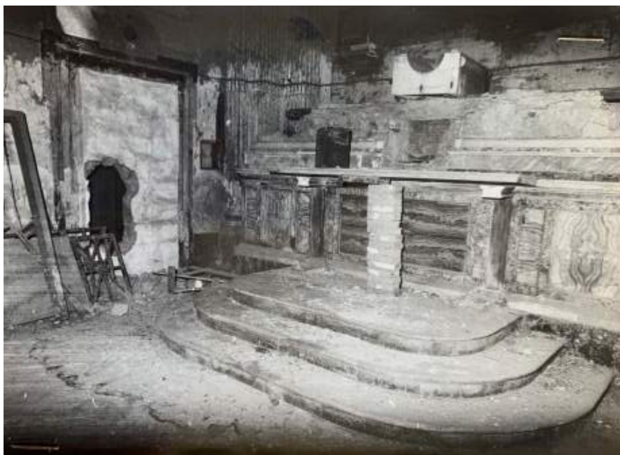
foto altare Maggiore

FOTOGRAFIE datate Dicembre 1994 Soprintendenza Beni Ambientali e Architettonici di Napoli e Provincia